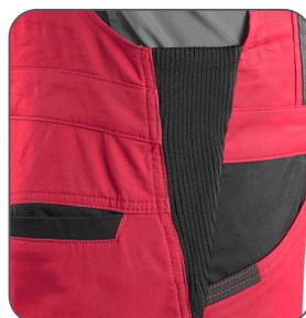
pruženka v bocích guma v bokoch elastic in the hips elastyczna gumka po bokach