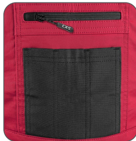
náprsní kapsy náprsné vrecká chest pockets kieszenie na piersi