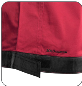
regulace v pase regulácia v páse adjustable waist regulowany pas