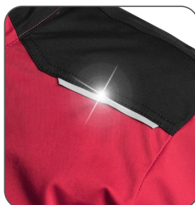
reflexní doplňky reflexné doplnky reflective accessories elementy odblaskowe